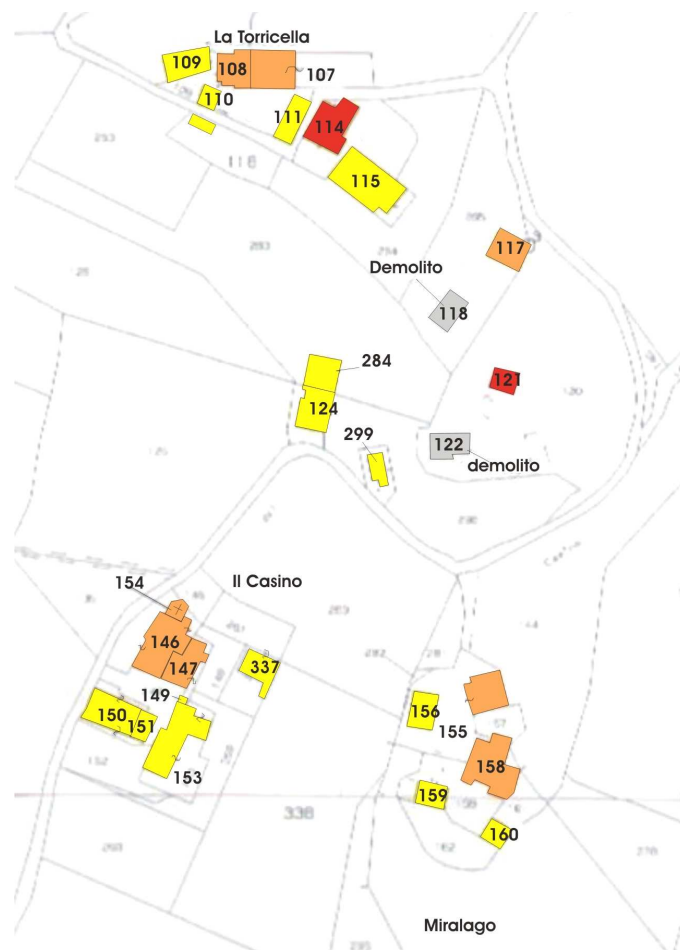
Stralcio di mappa catastale