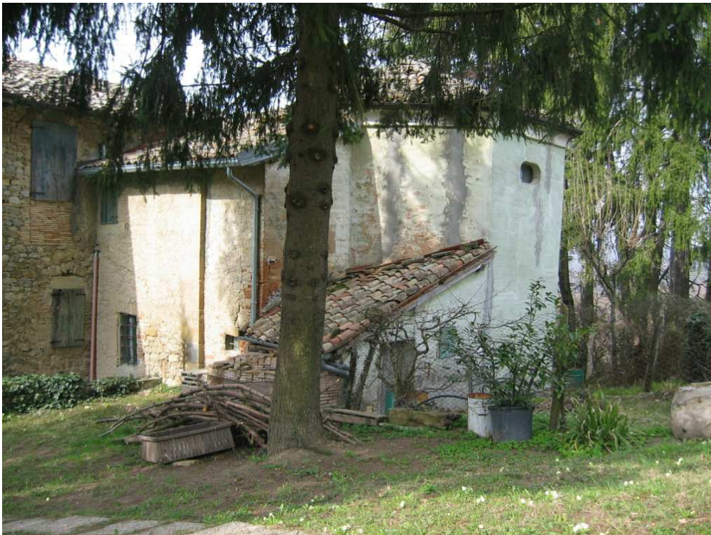
Foto n. 41: Il Casino. Oratorio settecentesco a pianta semiottagonale