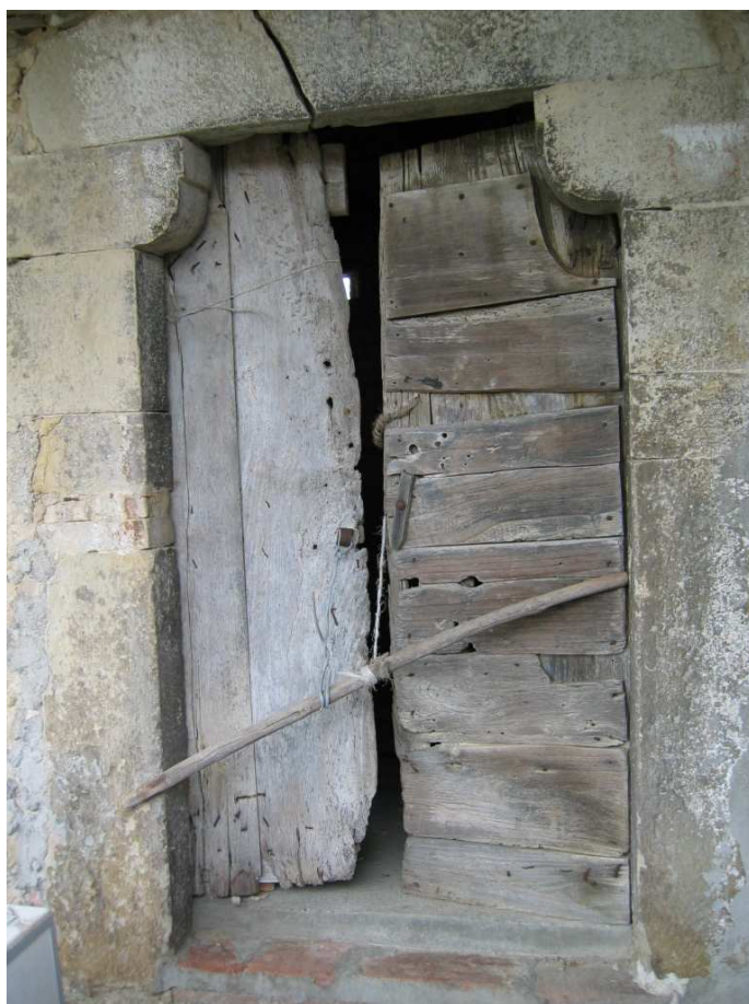
Foto n. 22: Miralago. Casa a balchio. Portale a mensole convesse del XIV sec.