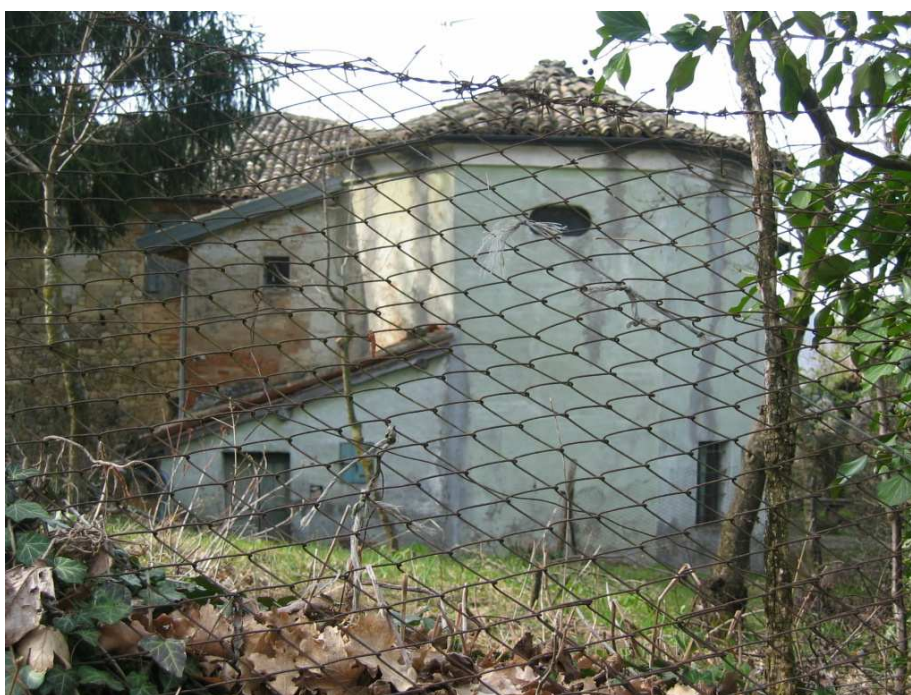
Foto n. 60: Il Casino. Oratorio settecentesco a pianta semiottagonale