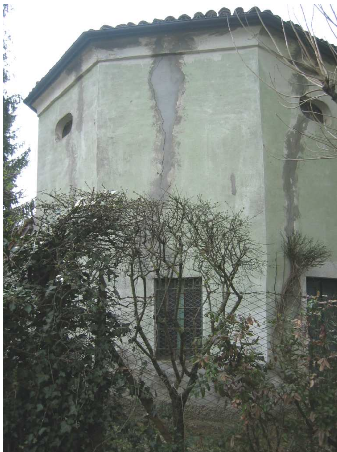
Foto n. 27: Il Casino. Oratorio settecentesco a pianta semiottagonale