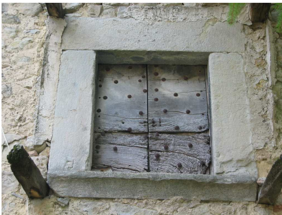
Foto n. 17: Miralago. Edificio rurale del XV sec. Particolare della finestra