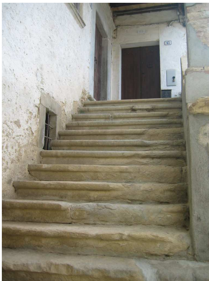
Foto n. 30: Il Casino. Casa a balchio, scalone in gradini monolitici di arenaria