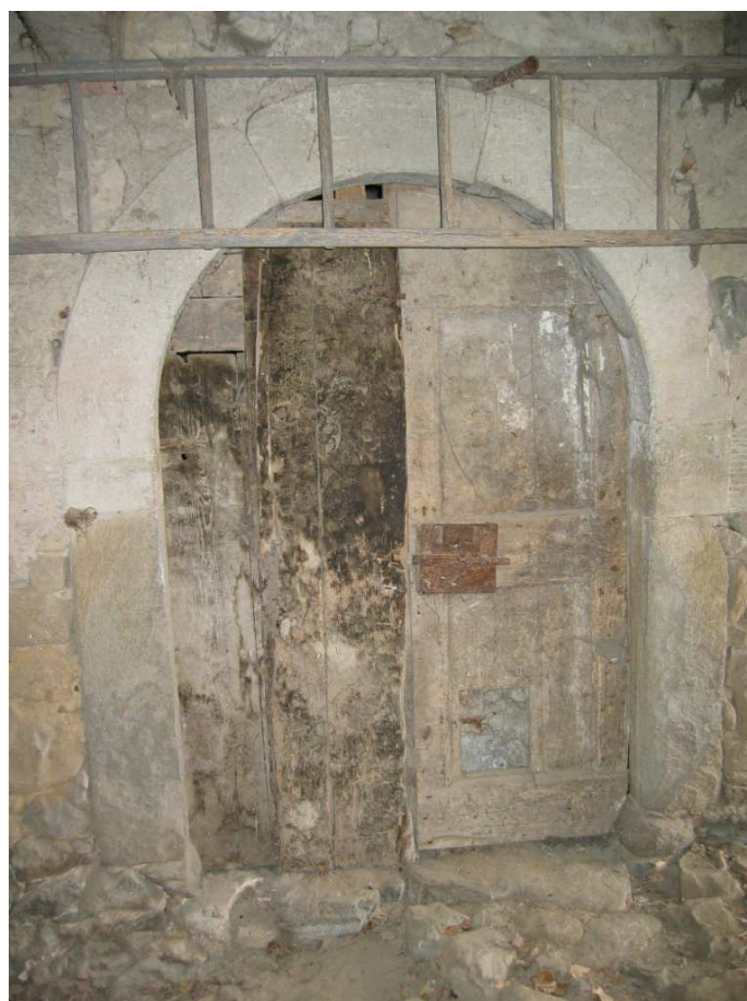
Foto n. 18: Miralago. Edificio rurale del XV sec. Particolare del portale.