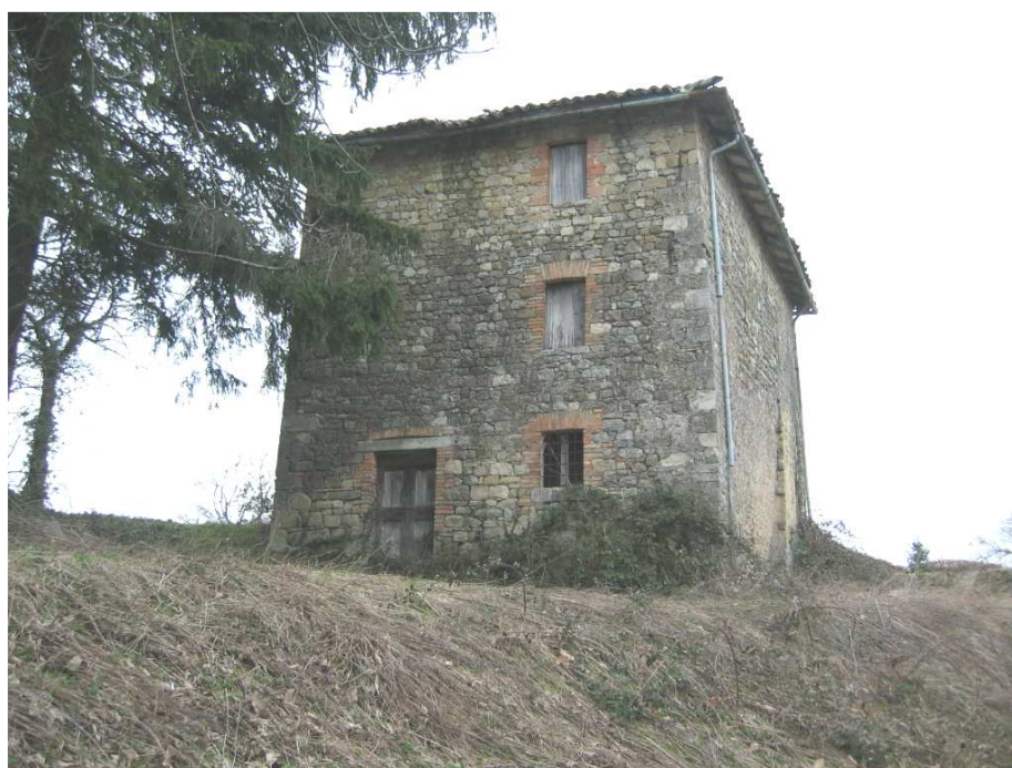
Foto n. 75 Torricella. Edificio in prossimità della torre