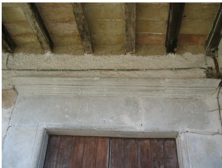
Foto n. 31 :Il Casino. Casa a balchio, architrave del portale rinascimentale