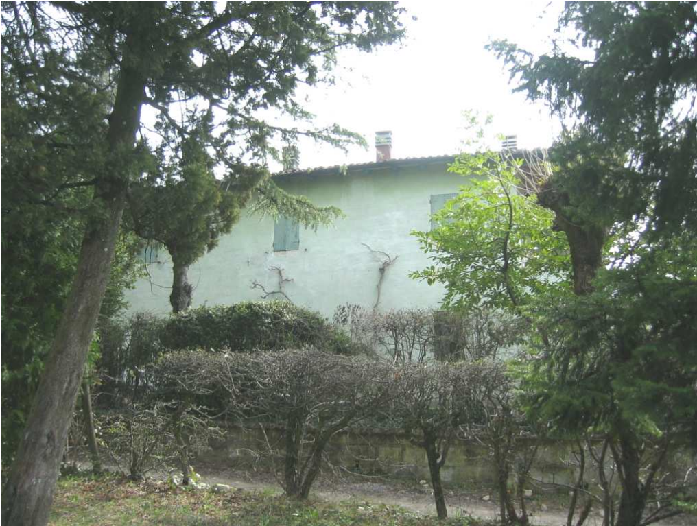
Foto n. 58: La cornice di piante sempreverdi caratterizza questi insediamenti